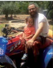
בדוקים את העירוב

עיקר פעילותי כיום היא במסגרת ה"מבצעים". בימי שישי אני מקדיש זמן למבצע תפילין, ולאחרונה התחלתי להתמקד באיזור התחנה המרכזית בעפולה, שם גם התרחש סיפור הנחת התפילין במקום בו ניסתה המחבלת לבצע פיגוע (ראה ע' פנימי).