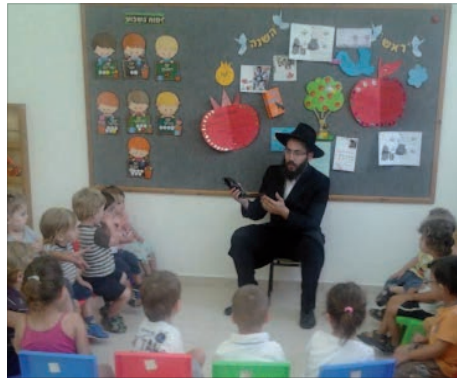
מבצע שופר בני ילדים

לשאלה כיצד הגיבו ההורים כשנוכחו לדעת כי הוא התקרב לחב"ד, הוא עונה שאומנם בתחילה הם ניסו לשכנעו ללכת על משהו "לייט" יותר, אך ככל שחלף זמן והם עיכלו שזו החלטתם הפנימית של בני הזוג, הם החלו לגלות שבנם דווקא מאושר, כך גם ילדיהם ובמילא גם הם נעשו מאושרים.