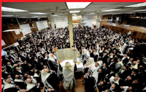
הקהל בחג הסוכות תשע"ו בית רבינו שבבבל - 770, 'ספר-תורה משיח' בתפילה עם כ"ק אדמו"ר שליט"א מלך המשיח.