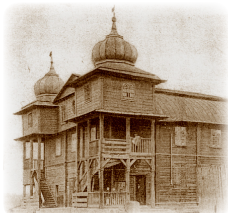
דער פראכטפולער שוהל אין שטאט גאמבין