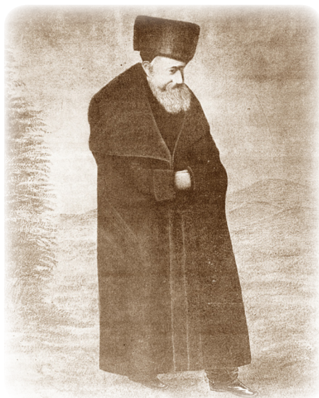
הגה"ק רבי יהושע מקוטנא זי"ע