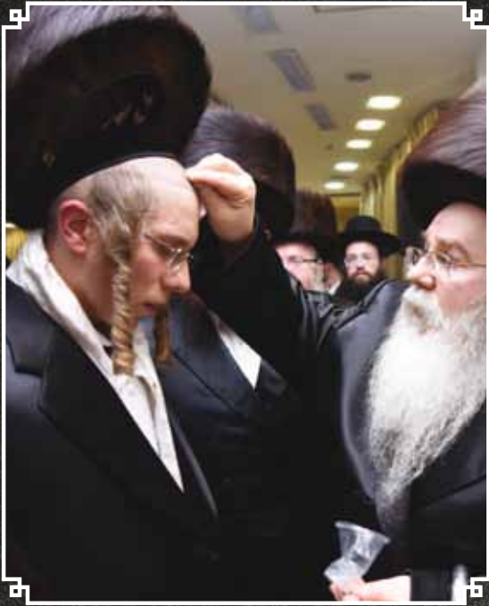
ציכום: משה גולדשטיין