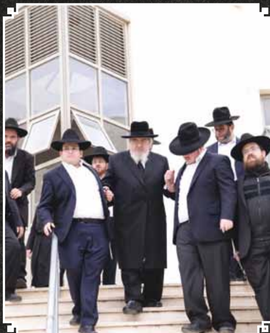
ציכום: שוקי לרר