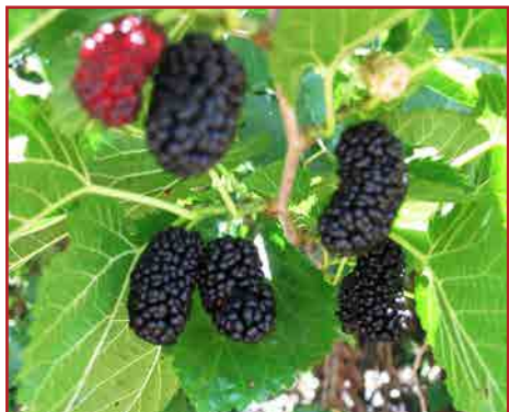
פירות תות העץ

התחלנו עם "טוואי המשי", ולכן נפרט מעט מה טיבו ומה מעלליו. זחל המשי של עץ התות, הוא מין של עש, 'בעל