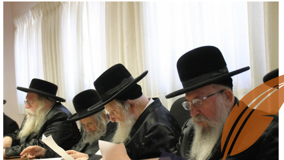
במושב הביד"צ פעיה"ק

רבי שלמה זלמן מתאר בפנינו את עוצם גדלותו של גיסו להבחל"ח כאשר זכה להתעטר