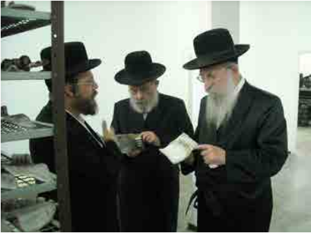
בבדיקת מפעל תפילין עם הגר"מ פרידלנדר זצ"ל מו"צ דעדהינו, נלב"ע אשתקד טבת תשע"ז

"בשעה שהגיעה לאזניו ידיעה כי אחד מגדולי התלמידי חכמים בירושלים מתגורר בשכונת בתי אונגרין בדירה קטנה ומצומצמת ואינו מצליח להסתדר,