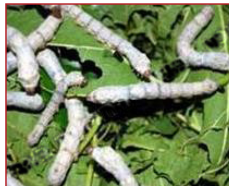
זחלים של "טוואי המשי" על עלי תות