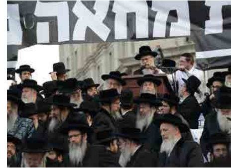
באמירת קבלת עול מלכות שמים בעצרת מחאה ענקית במנהטן נגד הגזירות על הדת בארה"ק

לדאבוננו בשיא פעולותיו כחצי שנה טרם פטירתו התמוטט ושכב על ערש דוי וכל בית