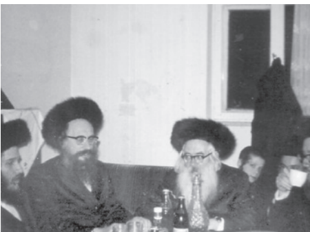
הגר"נ עם חותנו הגר"ד גולדשטיין זצ"ל

איש שיחננו שליט"א מרחיב בדבריו אודות השקעתו הגדולה של הגר"נ זצוק"ל להשכין שלום: "את מיטב כוחו ומרצו השקיע רבינו להשכין שלום, הן בין איש לאשתו, הן בין עמך בית ישראל, ולא אחת אף נקרא אל הדגל לפשר ולהשכין שלום בין אישים ורבנים חשובים" "עבור ענין זה היה משקיע כוחות גדולים,