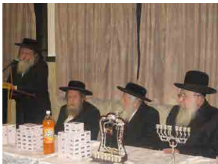
במעמד 'מגודלים בנעוריהם' בימי החנוכה בק"ק תפארת ירושלים

"לאחר נישואיו" מתאר רבי שלמה זלמן שליט"א "קבע גיסי זצ"ל את מושבו לעסוק