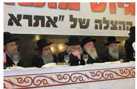
במעמד גיוס מתנדבים על משמר קברי ישראל - שבט