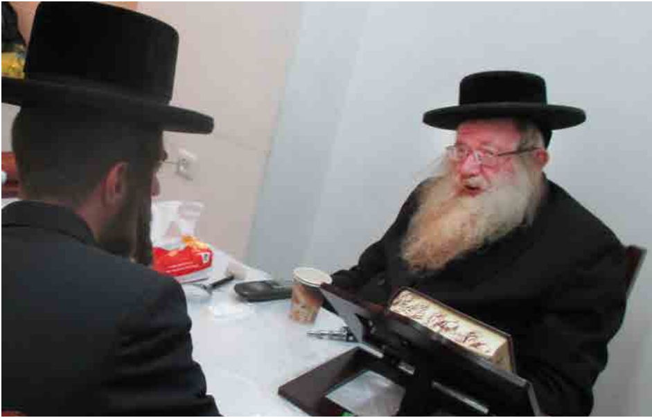
תמצית חייו היה לעזור ליהודי, הגרש"ז בנדיקט בשיחתו להעדה

ישראל העתירו רבות לרפואתו, כאשר פעמים מספר יצאו מרן הגאב"ד והביד"צ שליט"א בקריאות קודש "בקשו רחמים" כדי לקיים בנו חכמי ישראל.