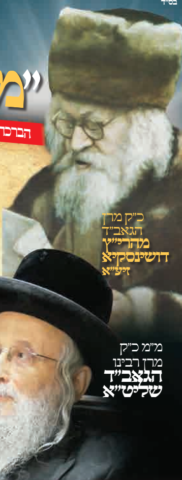
כ"ק מרן הגאב"ד מהר"י דושינסקיא זיע"א