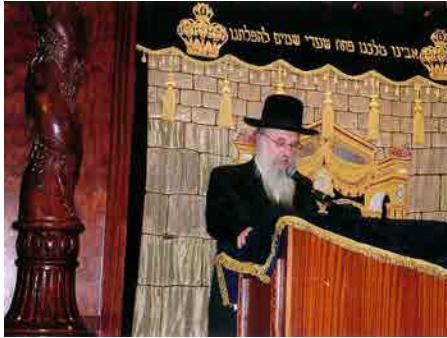
נואם בבימה"ד היכל מהרי"ץ דושינסקיא

וההדיר יש למנות את התשובות שו"ת מהרי"ץ למרן הגאב"ד הגה"ק מהרי"ץ דושינסקיא זצוק"ל, ועוד כמה ספרים עליהם עמל במלאכת מחשבת ויגיעה ממושכת".