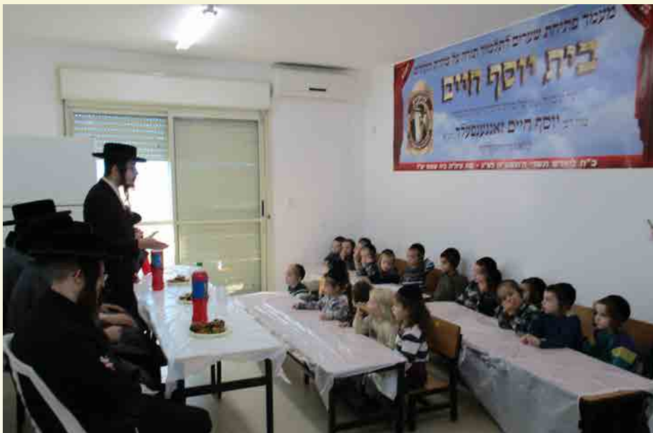
במסיבת יום ההצלה כ"א כסלו בכיתת הגן בת"ת בית יוסף חיים

ספק לימד אותי "תורת אמת", כי צורת האותיות הם ללא ספק נכונים, אך שאר המלמדים יתכן כבר לא זכו בכך, כי מפרשי התורה כבר נחלקו בכל דבר בפירושו ויתכן שכבר לא כיון המלמד לאמיתתה של תורה ממש. וכמו כן מוטל עלינו להבין כי בכל מה שילמד הנער ברבות הימים יש לו לאותו המלמד חלק בתורתו, כי רק באמצעות הידיעה בתחום הקריאה זוכה הנער להגות בלימודו ולהבינו.