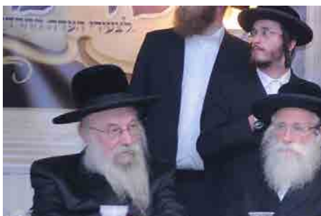
בוהפתתו האחרונה בכינוס אשרינו - ניסן תשע"ו