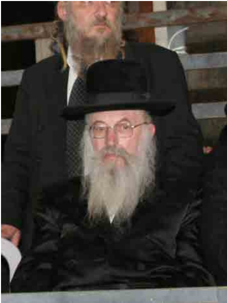
בעצרת נגד חיטוטי שכבי בככר השבת

הגאון בעל דובב מישרים מטשעבינ' צוק"ל, פעם התבטא ר' ישכר דוב בפני ואמר שזכה להיות 18 שנים בצלו של הטשעבינ'ער רב ומעולם לא שמע ממנו אפילו שגיאה או טעות אחת - קטנה ככל שתהיה, לא במראה מקום ולא בדיוק מסוים וכדו" מציינ רבי שלמה זלמן שליט"א.