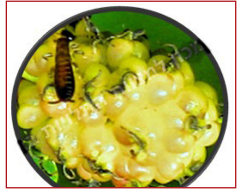
תריפס בינות לגרגרי תות בלתי מבושל - בהגדלה