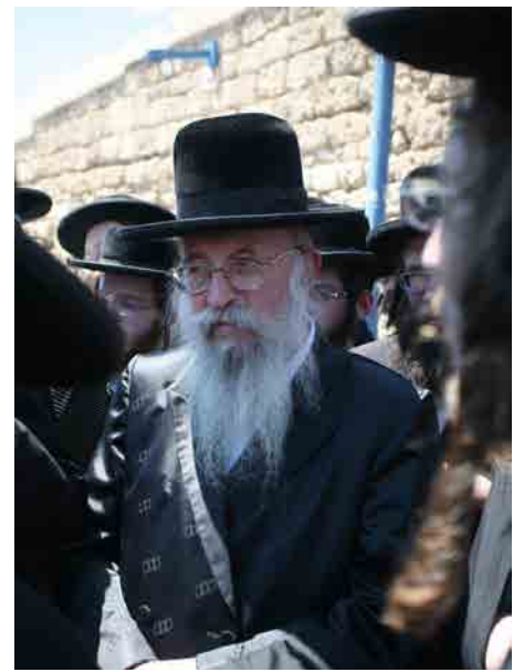
בעצרת נגד חילולי הקברים ביפו - תמוז תש"ע

דבר הלכה בכל חלקי השו"ע. לימים אסף את חלקם של תשובותיו שהשיב לשואליו ודברי המו"מ כדרכה של תורה עם גדולי פוסקי דורנו, והדפיסם בספרו הנודע "אמרי בינה" המקיפים שאלות בכל תחומי החיים הנוגעים לחיי המעשה ופלפולה של תורה, המגלים טפח מהיקף ידיעותיו ושגב עיונו.