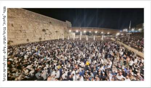
תמונה: 'מרחם' בבית העלמין

באופן השלילי של מבחן, אלא איפכא - אבינו מלכנו יודע את סערת-הלב; מכיר את נבכי נפשנו ואת התמורות שחלות. והוא מכיר גם את התשוקה הפנימית העמוקה שלנו להיות טובים יותר. לפתוח מחר דף חדש. הוא מכיר את שבע הנפילות. והקימות. וחוזר חלילה“.