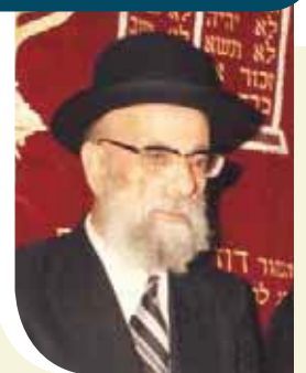
הגר"י צדקה זצ"ל