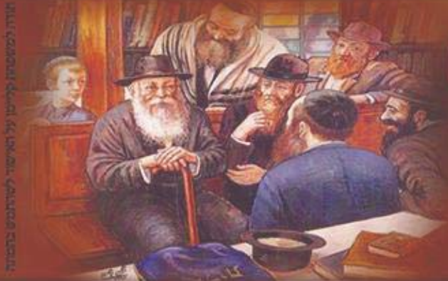
תורה למשפחה לקיבוץ על האישור לפרויקט התורה