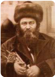
הילולת מרן רבי מאיר שפירא מלובלין זצוק"ל (ז' בחשוון)

גדול הדור, מחולל ומייסד מהפכת הדף היומי, ראש ישיבת יח"ל (ישיבת חכמי לובלין) עליה נמנו בין היתר תלמידו המובהק מרן רבי שמואל וואזנר זיע"א כן היה דודו של הרה"ר רבי ישראל מאיר לאו שליט"א, רבו של המהר"ם זצ"ל היה רבי ישראל פרידמן מטשורטקוב זצ"ל - נכד הרבי ישראל מרוזין זיע"א.