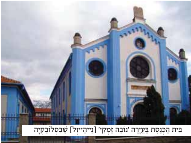
בית הכנסת בעירה 'נובה זמקי' [נייהייל] שבסלובקיה