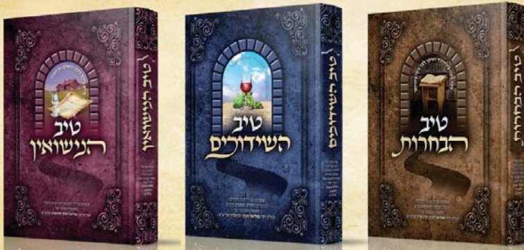
מאוצרו המנוצח של הגה"צ רבי גמליאל הכהן רבינוביץ שליט"א

להשיג בחנויות הספרים המובחרות הפצה ראשית מרכז הספרים בהנהלת הרב יצחק פרידמן 03-6194114