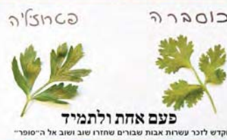
פעם אחת ולתמיד מוקדם לזכר עשרות אבות שבורים שחזרו שוב ושוב אל ה"סופרי"

מגדל הפיקוח לטייס. ציין מה הגובה שלך והיכן אתה נמצא. גובהי 1.85 ואני בתא הטייס