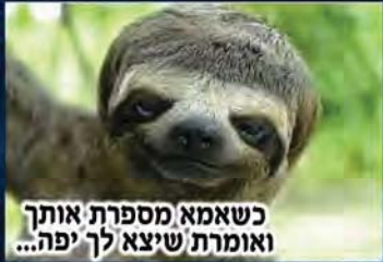
כשאמא מספרת אותך ואומרת שיצא לך יפה...

טיפ: כדי להימנע מהסחרחורת הזאת שמקבלים כשקמים מהר מידי, מומלץ להישאר במיטה כמה שעות נוספות. רק ליתר ביטחון.