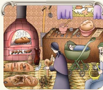
יסוד התורה הקדושה זה מדות טובות הנתינה והשמחה בה...!

וכן כאשר אדם רואה שהשני מצליח ומסדר בחייו, ואלו הוא בקשי מצליח לגמור את החדש, במקום להתמלא בצרות עין וקנאה עלינו להתבונן שההצלחה של השני, הנה ההצלחה שלנו. וזה דומה לאח אחד שהתעשר והוא עוזר ומסייע לכל בני המשפחה שכלם שמחים בעשרו, כך כאשר השני מצליח; אם נהיה חכמים לשמח בכך נרויח מזה, יתכן שהבן שלנו ישתדד עמו, יתכן שהנכד ינהה מהטוב שיש לשני. כבר למדנו חז"ל 'אין אדם נוגע במוכן לחברו' אף אחד לא לוקח לה, נותנים לה! רק תראה עם עין טובה.