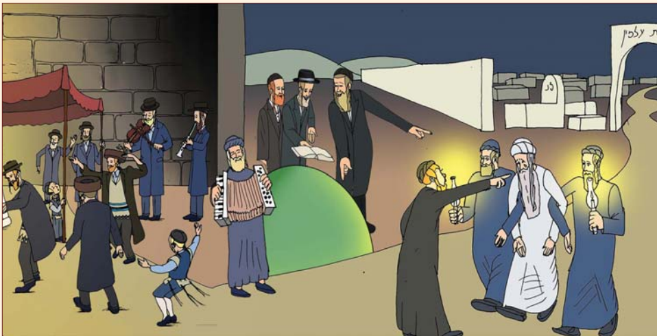
על כך במאמר: 'מתיקות הפגישה עם ה' ובמאמר: 'מתיקות האוצר של בעז'.

מהו הקשר בין מנוח, שעליו אנו קוראים בהפטרות פרשתנו - נשא, לבין מה שבעז נשא את רות המואבית, שאת זה אנו קוראים בחג השבועות?