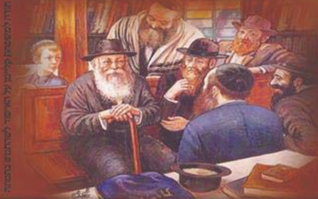
תורה למשפחה קיימת על הישיבה לפרשת במדבר